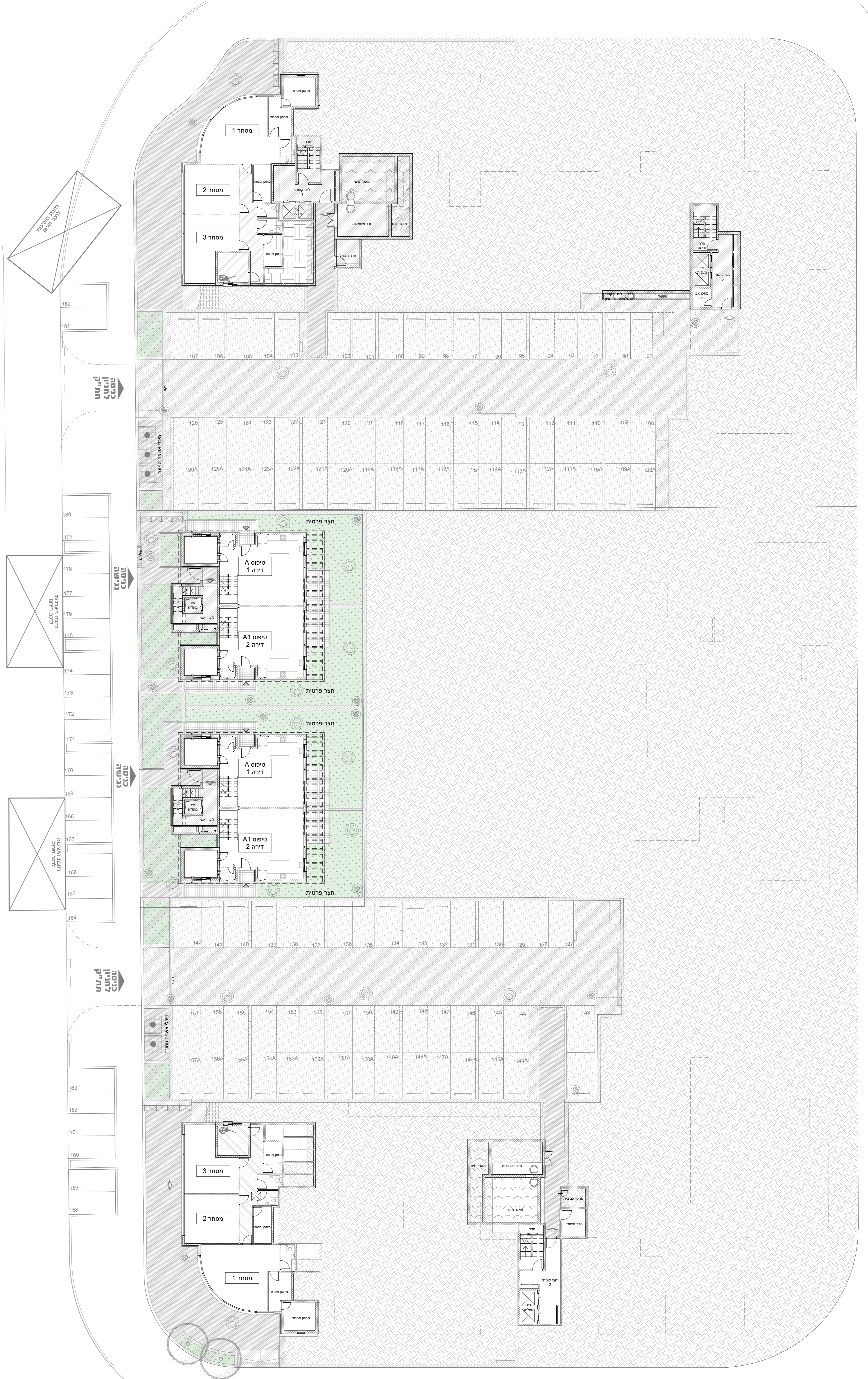
קומת חניון- תוכנית סביבה ק"מ 1 : 200

טרם התקבל היתר. יתכנו שינויים והתאמות ככל שידרשו ע"י הרשויות המוסמכות, המתכננים והיועצים השונים.